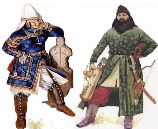
селяющих наш край в древности.